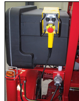
Boîtier de commande de translation